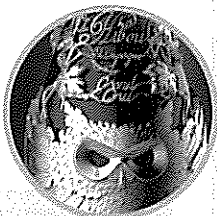
Le Bal du Hibou香 槟瓶身设计