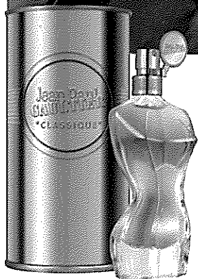
Jean-Paul Gaullier Classique et Le Môle 香水瓶设计